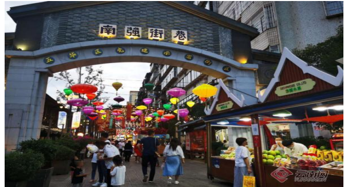
ค่ำ รับประทานอาหารค่ำที่ภัตตาคาร... (เมนูสุกี้เห็ดที่ขึ้นชื่อของยูนนาน)

พักที่ HAPPY CASTLE INTERNATIONAL HOTEL / เทียบเท่า ( 5 ดาว)