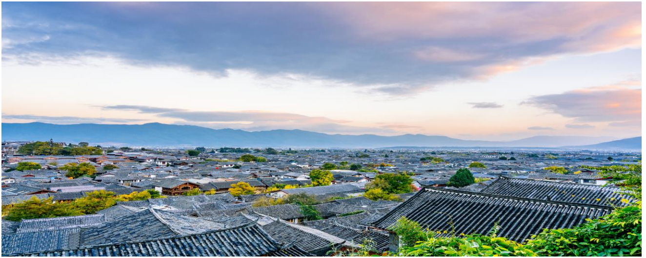
พักที่ LIBRE RESORTS LIJIANG HOTEL / เทียบเท่า ( 5 ดาว)